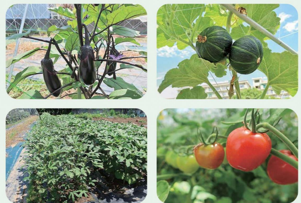
新触感のミニトマト「プチぶよ」

高齢化や後継者不足、農地面積の減少などの課題がある中、安定的な農業経営の確立はもちろんのこと、消費者と近接しているという立地条件を生かした取り組みをしていくことが必要と考えます。