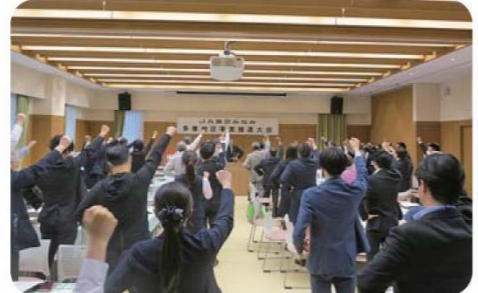
多摩地区事業推進大会の様子