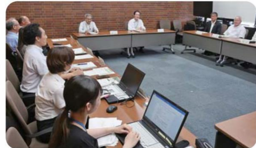
連絡協議会の様子

令和6年7月4日(木)、日野市、農業委員会との連絡協議会が実施されました。この連絡協議会は、市長をはじめ、市の幹部職員と農業委員会会長、会長職務代理、当JAの常勤役員他、担当部長、支店長が出席し、今後の都市農業の課題などの意見交換の場として開催されるものです。今回は「農地保全と若手を中心とした担い手の育成」について意見交換が行われました。