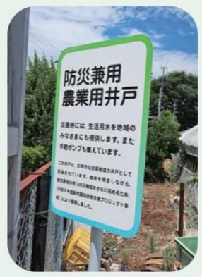
防災兼用農業用井戸