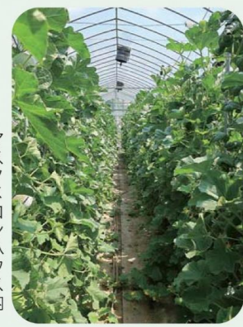
マスクメロンハウス内